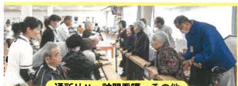
通所リハ・訪問看護・その他