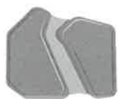
クイックフィット

L300Go® は4つの電極から選択できます。「クイックフィット電極」と「ステアリング電極」はモーターポイントを探す必要がありません。