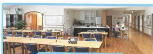
サービス付き高齢者向け住宅