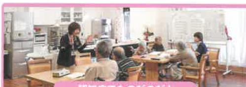
認知症でものびのびと