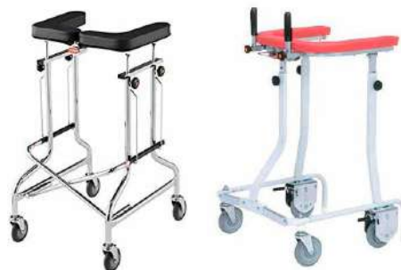
身体状況に合わせて歩行速度が調整可能