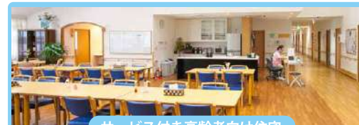
サービス付き高齢者向け住宅