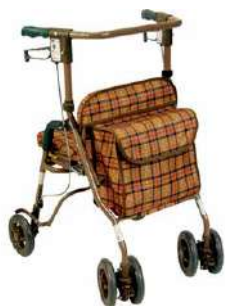
握力が弱い方も 片手でブレーキがかけられます