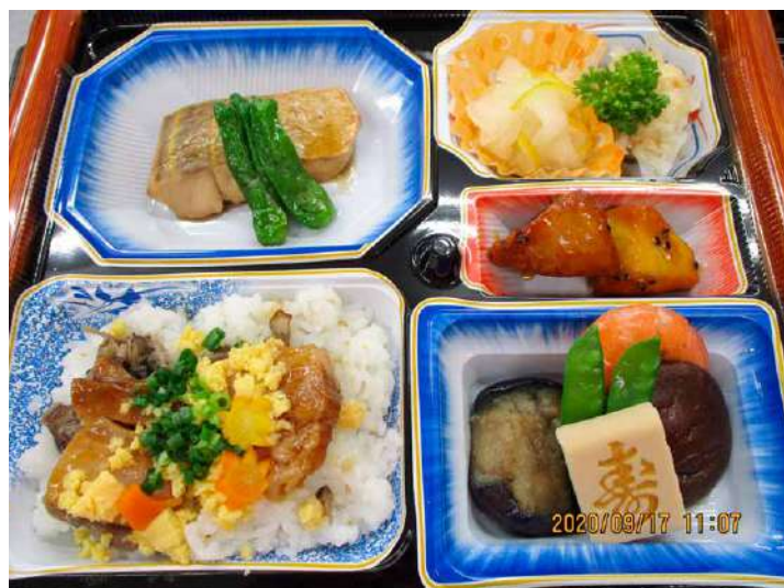
夢館 敬老会の食事