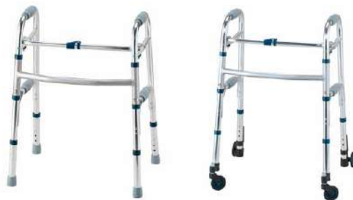
両手で歩行器を持ち上げて、前方に運んで使用します。