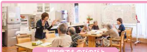
認知症でものびのびと