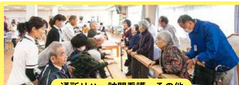
通所リハ・訪問看護・その他