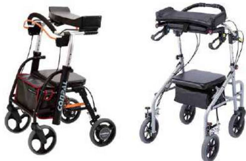
上肢や体幹が不安定な方をサポート