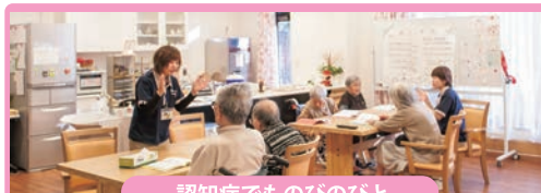
認知症でものびのびと グループホーム吉原