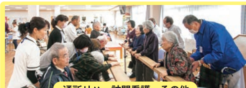
通所リハ・訪問看護・その他 在宅サービス