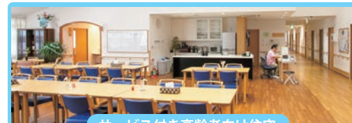
サービス付き高齢者向け住宅 ドリームハウス吉原